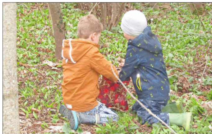
Wir sammeln Bärlauch für unser Freitagsfrühstück

Gemeinsam unterwegs Die meisten unserer Kitakinder gehen sehr gerne nach draußen und entdecken die Natur. Vor einigen Tagen waren wir mit den Kindern unterwegs, um Bärlauch zu sammeln. Die Mädchen und Jungen wissen schon genau wie Bärlauch aussieht, wie dieser riecht und wie Bärlauch sich anhört, wenn man ihn bricht. Viele unserer Kindergartenkinder sind bereits richtige Bärlauch-Experten.