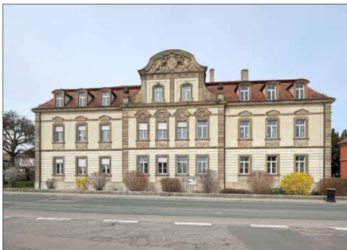
1901 als Königlich Bayerisches Amtsgerichtsgebäude erbaut, ist das Gebäude vielen als „Haus der Kirche“ ein Begriff. Erhalten ist das Königlich-bayrische Wappen. Das Gebäude soll verkauft werden.