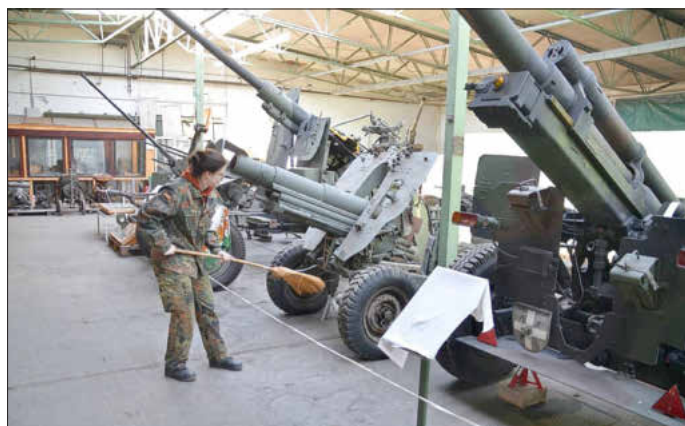
Entstauben der Kanonenhalle