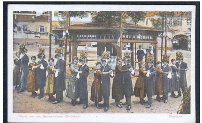
Gruß von der Gochsheimer Kirchweih / Plantanz.