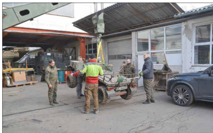
Umzug KraKa Luftladefahrzeug