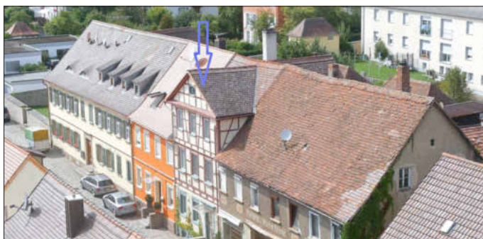
Foto: Text und Bilder: N.H. Quelle u.a. „Rechter - Häusergeschichte von Uffenheim“