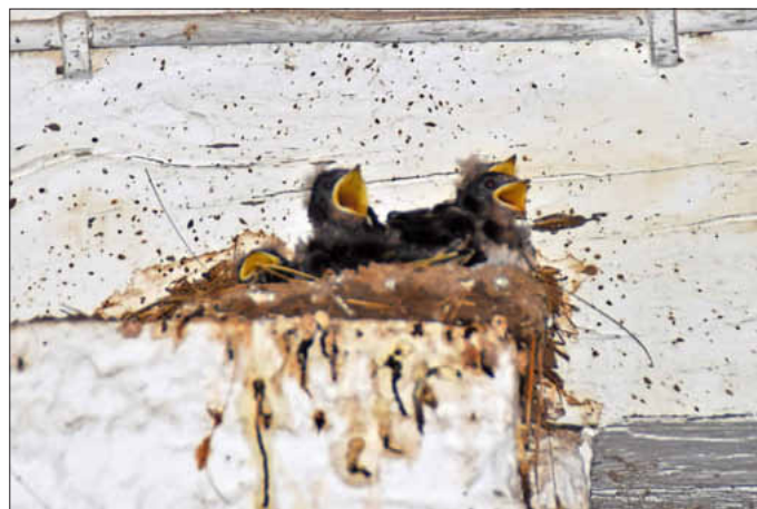
Hungrige Mäuler wollen gestopft sein.