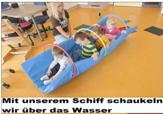
Mit unserem Schiff schaukeln wir über das Wasser

Große gespannte Kinderaugen, ob das Schiffchen schwimmt. Natürlich hat auch jedes Kind sein eigenes Schiffchen gebaut, um es Mama und Papa zu Hause zu zeigen. Begleitet mit dem Singspiel „Schiffchen auf dem blauen Meer“ sowie einer kleinen Turnstunde, fühlten sich die Jungen und Mädchen wie kleine Kapitäne.