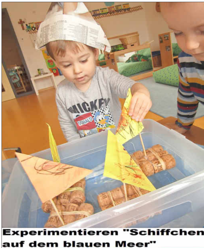
Experimentieren "Schiffchen auf dem blauen Meer"

Garten suchen und darin umherspringen, das macht allen Kindern eine große Freude. Die Krippenkinder haben experimentiert und gemeinsam Schiffe gebaut, um diese schwimmen zu lassen.