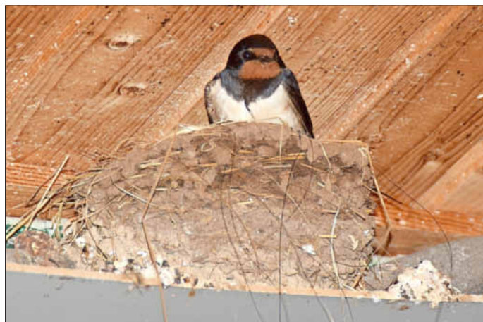
Ein Elternteil sitzt zum Brüten im Nest.