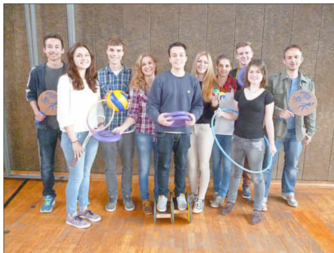
Das Foto zeigt einen früheren Kurs mit extrem vielen Teilnehmern aus „den eigenen Reihen“ der SBU.

Vor den Herbstferien (24./25.10) geht es bereits mit einem Wochenende los (jeweils fast durchgehend von 08:30 bis 18:00 Uhr), dann müssen die Teilnehmer in den kompletten Ferien (31.10. bis 8.11.) anwesend sein, bevor am 13. und 14. November die „Prüfungstage“ anstehen. Neben der schriftlichen Theorieprüfung muss dann eine Art „Lehrprobe“ gehalten werden. Wer das alles erfolgreich bewältigt, erhält den „Übungsleiterschein“ und kann damit in jedem Sportverein tätig werden und andere professionell anleiten, Sport auszuüben. Wer Interesse hat und ab Ende Oktober bereits 16 Jahre alt ist, kann sich