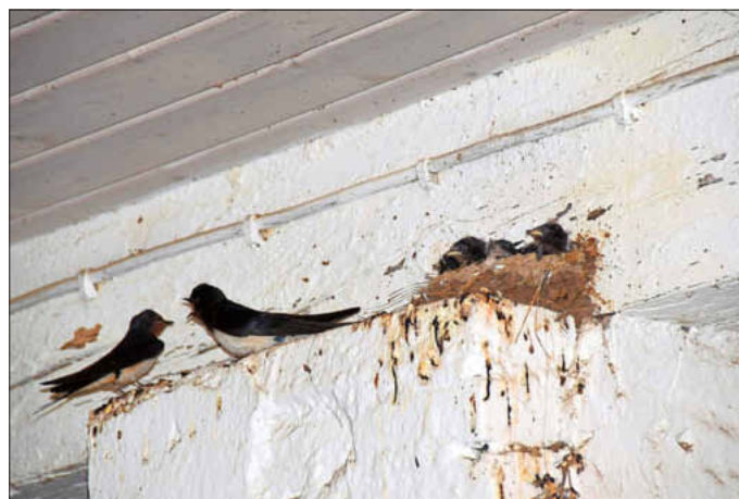
Die Schwalbeneltern tauschen sich über ihren Nachwuchs aus.