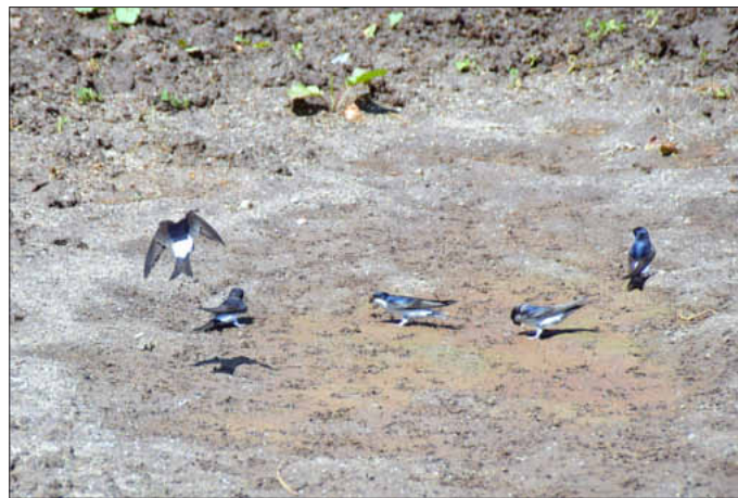
Hier decken sich Mehlschwalben mit lehmigen Material für den Nestbau ein.