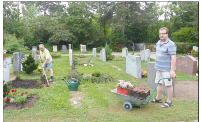
Vater und Sohn Hirt sind begeistert von den „mobilen Helfern“

Die Verantwortlichen der Evang. Kirchengemeinde Uffenheim appellieren als Träger des Friedhofs an die Vernunft der Bürger. „Wir bitten um einen entsprechend verantwortungsvollen Umgang mit den angeschafften Wägen, die nur auf dem Gelände des Friedhofs genutzt werden dürfen, damit sich viele Nutzer*innen lange daran erfreuen können“, wünschen sich die Kirchenvorsteher*innen mit Vertrauensmann Hans-Martin Walther.