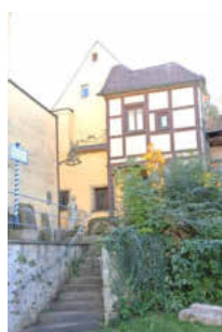
Antwort Nr. 30

Der im letzten Mitteilungsblatt gezeigte Giebel befindet sich auf der Ostseite des Heinrichsturmes und wurde vom Heisenstein aus abgelichtet. Beim Heinrichsturm handelt es sich neben dem Folterturm und dem Schnellerturm um eine der drei Eckbastionen der Uffenheimer Stadtbefestigung. Die Errichtung dieser Eckbastionen erfolgte am Ende des 16. Jahrhunderts, wie auch der Vorbau der Barbakanen an den beiden Stadttoren, als Reaktion auf die Entwicklung der Feuerwaffen. Die aus dem Stadtmauerring herausragenden Bastionen und Barbakanen dienten als Kanonenstationen, von denen aus man die Bereiche entlang der Stadt-