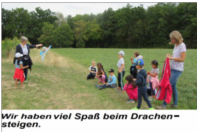
Wir haben viel Spaß beim Drachensteigen.

Bevor die vielen Eingewöhnungen in den Gruppen stattfinden wurde in allen Gruppen die Zeit zwischen den Sommerferien und erstem September unterschiedlich genutzt, wie z.B. einen aufregenden Ausflug zu den Obstbäumen und zum Drachensteigen. Die Natur hautnah erleben und die ersten Züge des Herbstes spüren, die leckeren Äpfel schmecken, den Drachen lenken, das macht den Jungen und Mädchen viel Spaß.