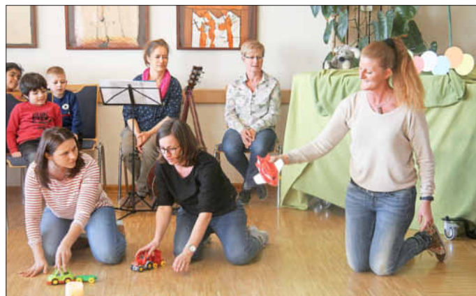
„Allein sein ist nicht schön“ - das war das Thema des letzten Kigo im Kiga PLUS. Die Zachäus-Geschichte bildete den biblischen Hintergrund.

In unserem Kindergarten und somit auch in der „Bibelentdecker-Gruppe“ gibt es auch Kinder und Familien aus fremden Kulturkreisen mit anderer oder gar keiner Religionszugehörigkeit. Auch dies ist ein weiterer Aspekt der Zukunftstauglichkeit, denn es geht sowohl im Kindergottesdienst als auch im Kindergarten um gegenseitige Akzeptanz, den wertschätzenden Umgang und das Lernen von und miteinander. Die Gemeinschaft, die die Kinder erleben und auch die Freude, die sie bei „Bibelentdecker“ haben, macht dann auch Eltern oft neugierig, selbst einmal teilzunehmen.