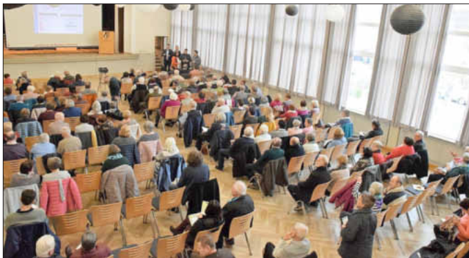
Vielen Informationsstände beim ersten Gesundheitstag in Uffenheim bieten Antworten auf viele Fragen. Tag2_