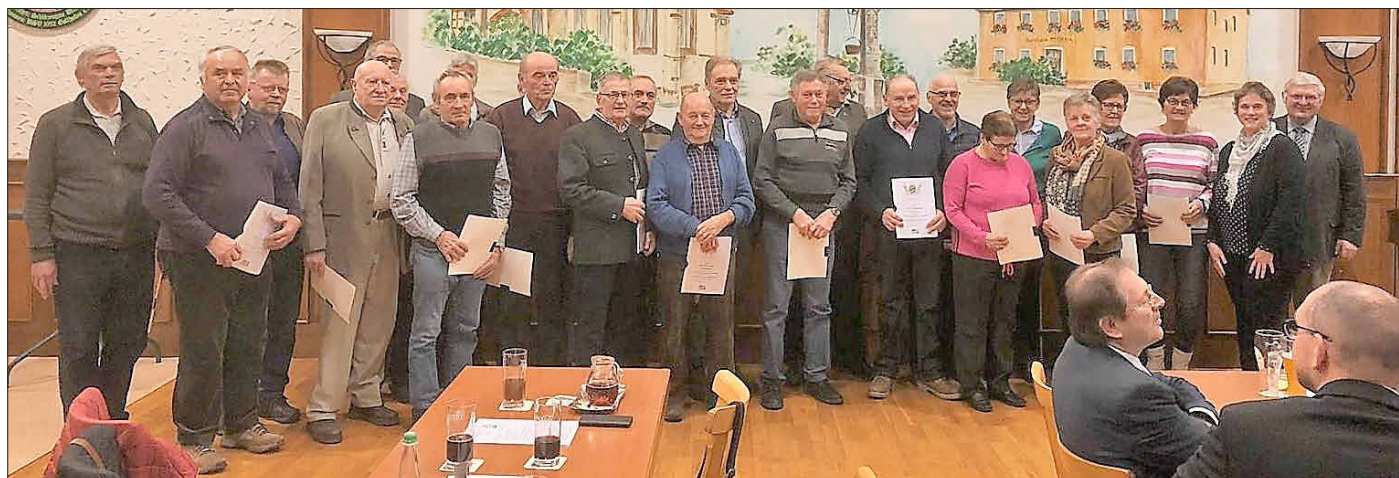
Viele Mitglieder des Verbands für landwirtschaftliche Fachbildung erhielten für ihre langjährige Verbundenheit zum Verband eine Auszeichnung.