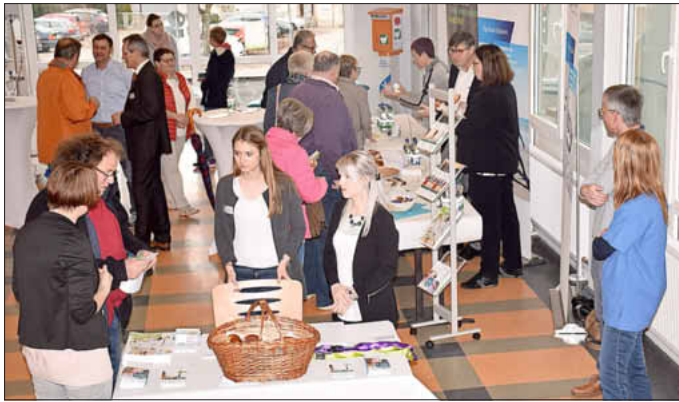
Viele interessierte Bürger kamen zum ersten Uffenheimer Orthopädischen Gesundheitstag.