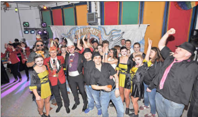
Die Freiwillige Feuerwehr Uffenheim bescherte mit ihrem Kappenabend den Uffenheimern wieder einen vergnüglichen Abend.