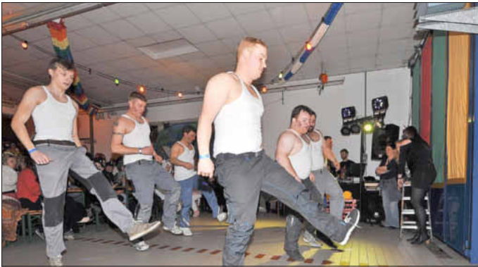
Viel Applaus gab es auch für das Männerballett Welbhausen.