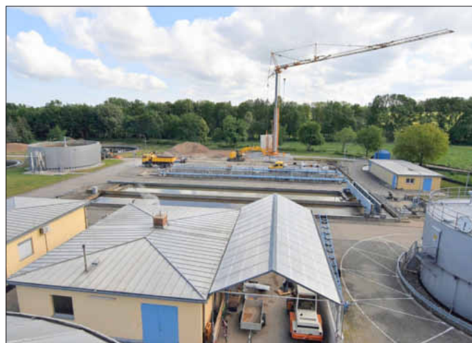
Kran und Baumaschinen sind derzeit auf der Uffenheimer Kläranlage im Einsatz.