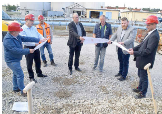
Pläne und Zeitplan für die Kläranlagenerweiterung wurden studiert.