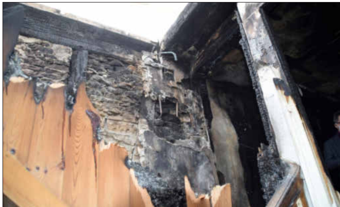
Durch einen technischen Defekt in der Hauselektrik wurde der Brand ausgelöst. Von dieser Stelle aus breitete sich das Feuer aus.