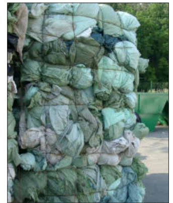
Die abgegebene Agrarfolie in gepresstem Zustand.

Für Fragen steht die Abfallwirtschaft gerne zur Verfügung unter der Telefonnummer 09161 92-3440.