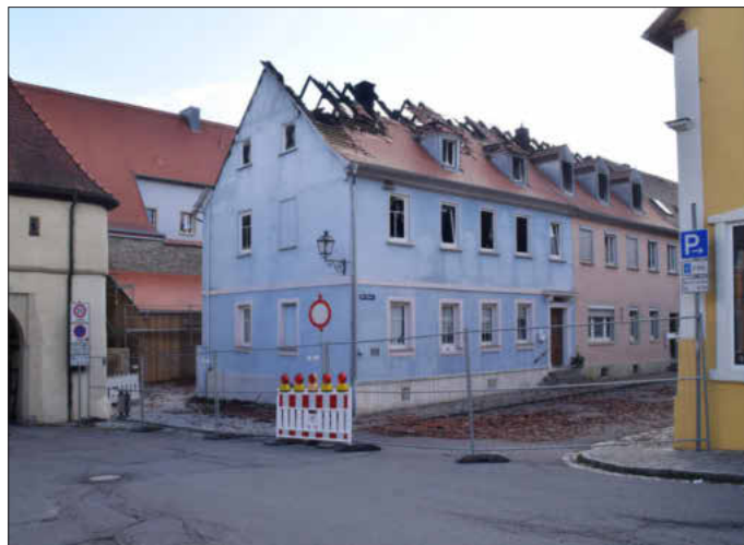
So sah das Anwesen aus, als alles gelöscht war.