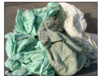
Zum Beispiel Wickelstretch wird bei der Foliensammlung angenommen.