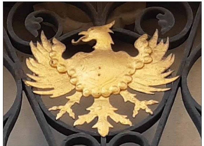
Text und Bild: N.H. unter Mitwirkung von Frau Christa Hendel

Frage Nr. 8 Welches Gebäude ziert dieser goldene Adler?