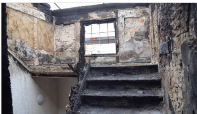
Die Treppe endet im Nichts.