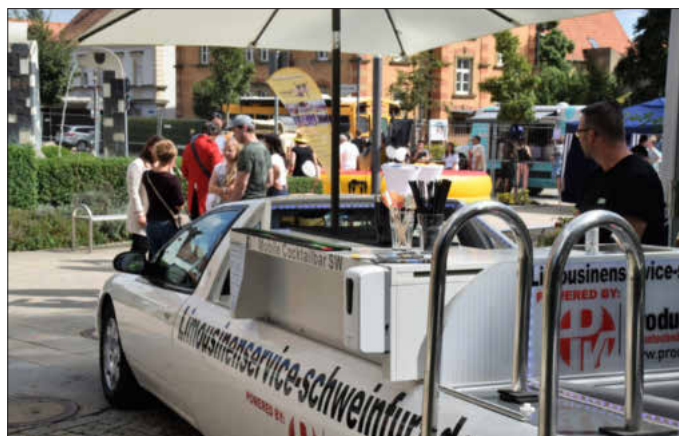
Limousinenservice, Bullriding, Hüpfburg oder Food Trucks gab es im Außenbereich der Stadthalle. Für den schönsten Tag im Leben kann man alles auch mieten