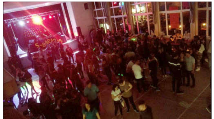
Ausgelassene Stimmung bei S-Barados

Der Gewinn aus der Veranstaltung, mehrere Tausend Euro, geht zu 100 Prozent an das Jugendcafé „S-Bar“ und fließt in den laufenden Betrieb ein.