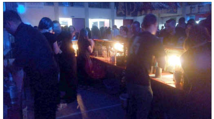
Viele Helfer sorgten für reibungslosen Ablauf und tolle Location