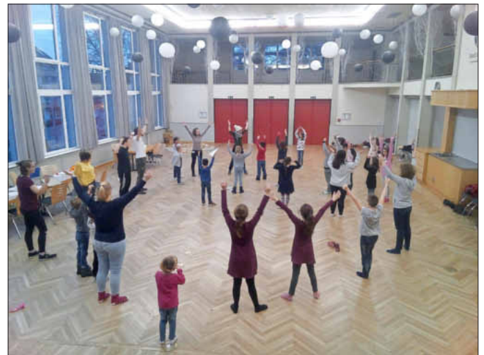
Stadthallenkids - ein beliebtes Angebot