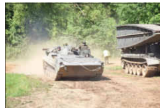
Ein schwimmfähiges Bergefahrzeug zeigte seine Beweglichkeit.