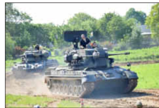
Der Flugabwehrkanonenpanzer Gepard ist natürlich vollständig demilitarisiert.