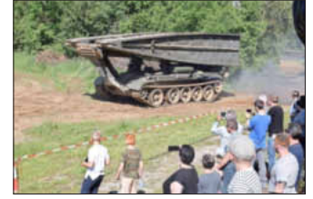
19 Meter schafft der Brückenlegepanzer zu überbrücken.