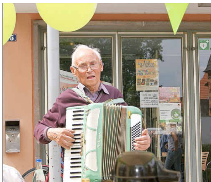
Die Nachbarschaftshilfe bietet u.a. an, gemeinsam zu musizieren und bei Spaziergängen zu begleiten.