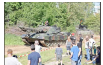
Der Leopard ist bei jeder dynamischen Fahrzeugschau das Highlight.