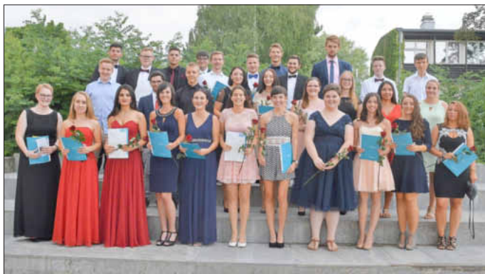
Bestanden: Die 31 Absolventen der Fachoberschule für Sozialwesen sowie Wirtschaft und Verwaltung der Christian-von-Bomhard-Schule freuen sich über ihr Fachabitur.