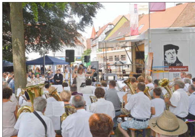
Gut besucht war der ökumenische Gottesdienst im Rahmen des Christusfestes in Uffenheim.