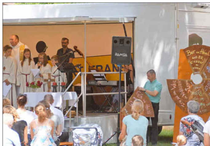
Aus vielen Brotworten der Jugendgruppen wurde ein ganzer Laib.