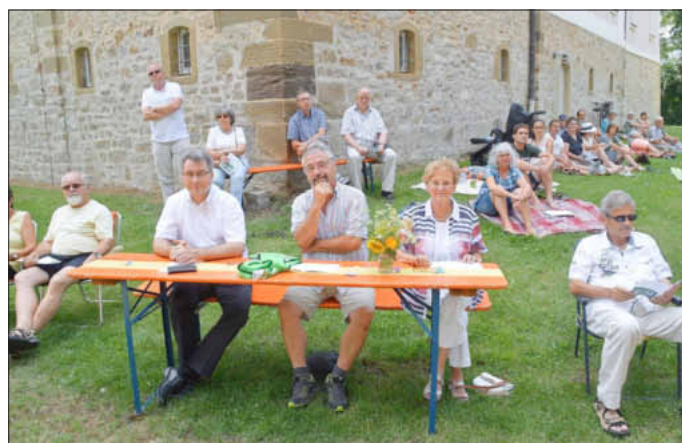
Viele hatten Campingstühle oder Decken zum Ökumenischen Gottesdienst im Uffenheim Schlosspark mitgebracht.