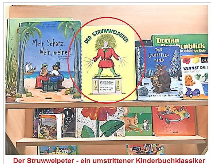
Der Struwwelpeter - ein umstrittener Kinderbuchklassiker

Ob der Struwwelpeter ein geeignetes Buch ist, muss natürlich letztlich jeder für sein Kind entscheiden.