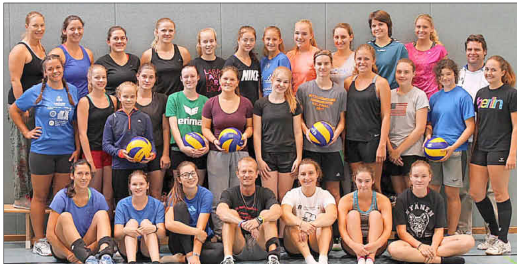
Bereits beim letzten Trainingslager arbeitete man zusammen.