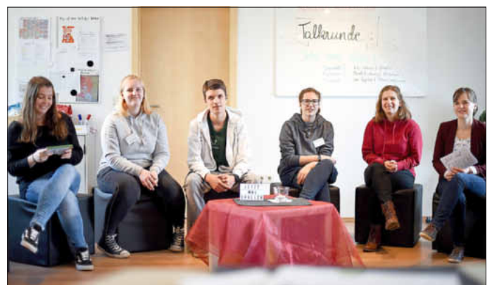
Talkshow zum Thema „Jetzt mal ehrlich“ mit Ehemaligen

Am Nachmittag gab es rund um das ehemalige Bahnhofshotel, das inzwischen das Lebenstram-Jahr, eine Pizzeria und einige Privatwohnungen beherbergt, ein buntes Programm. Ehemalige Teilnehmer aus verschiedenen Jahrgängen des Orientierungsjahres erzählten von ihren Erfahrungen und wie sich das Jahr in ihrer späteren Laufbahn ausgewirkt hat.