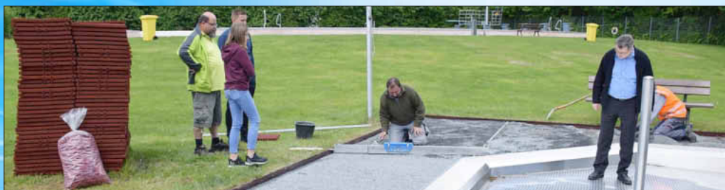
Derzeit werden die Fallschutzplatten um das Planschbecken herum vom Bauhof der Stadt erneuert.

Baugrund und Randeinfassung können erhalten bleiben. Neu sind auch die Sitzflächen und Lehnen der Bänke auf dem Badgelände. Das Erlebnisbad ist mit einigen Attraktionen ausgestattet: 50 Meter-Rutsche, Schwallduche, Wasserpils, Whirl-Liege und Luftblubber, Sprungturm, separates Kinderplanschbecken in der großflächigen Liegewiese, Beach-Volleyballplatz und Tischtennis. Das Wasser wird beheizt durch ein Blockheizkraftwerk und eine Solarabsorberanlage. Ein Kiosk mit Sitzplätzen im Freien sorgt für das leibliche Wohl. gk