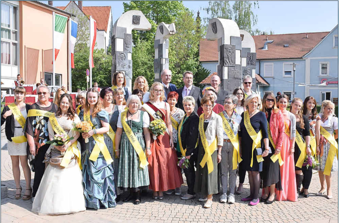
Viele ehemalige Maienköniginnen kamen zum Empfang vor der Stadthalle.

Seit 1960 kürt die Stadt Uffenheim jährlich eine Maienkönigin für das Walpurgifest, das seit 1959 gefeiert wird. Manche Maienköniginnen waren auch zwei Jahre im Amt. Viele der ehemaligen Maienköniginnen waren der Einladung zum 60. Festzug gefolgt. Beim Empfang vor der Stadthalle waren schon die meisten ehemaligen Maienköniginnen da, einige kamen aber auch erst zum Festzug.