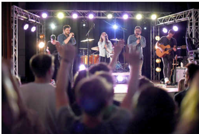
Konzert der Rock-Pop-Formation Koenige&Priester vor vollem Haus

Außerdem konnten Kinder und Erwachsene sich am Mittagessen, Kaffee, Kuchen gütlich tun. Eine Hüpfburg, Kinderschminken, verschiedene Workshops rundeten das Programm ab. Am späten Nachmittag wurde eine Verlosung durchgeführt, bei der man verschiedene Preise gewinnen konnte - unter anderem einen Noise-cancelling-Kopfhörer einer kleinen hessischen Firma, die faire Smartphones herstellt.