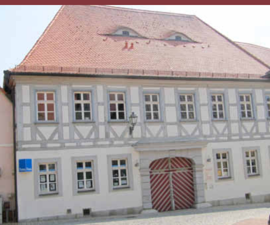
Wolfgang Lampe 1. Bürgermeister

Wir freuen uns auf Ihren Besuch und wünschen Ihnen viele frohe und vergnügte Stunden beim Walpurgifest 2017.