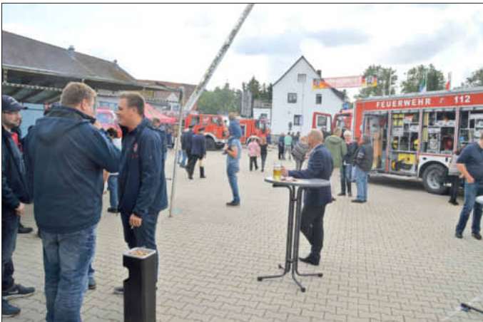
Viele Besucher nutzten die Gelegenheit, sich den Fuhrpark der Feuerwehr genau anzuschauen.