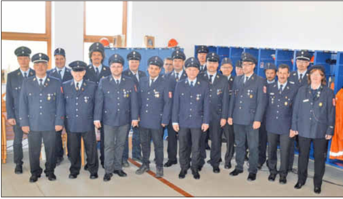
Das Ehrenzeichen in Silber für 25-jährige Dienstzeit gab es für 27 Feuerwehrleute.