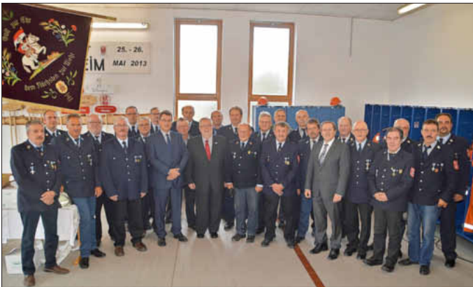
27 Feuerwehrleute erhielten beim Tag der offenen Tür der Freiwilligen Feuerwehr Uffenheim für ihre 40-jährige Dienstzeit das Ehrenzeichen in Gold.