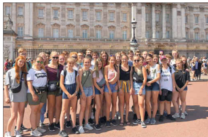
Text u. Bild: Marlene Donhauser