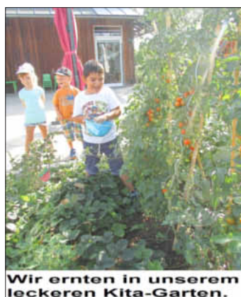
Wir ernten in unserem leckeren Kita-Garten.