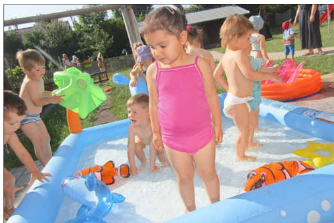
Badespaß in Krippe und Kindergarten.

Die Sommerzeit bei uns ist aber auch deshalb so schön, da wir unser im Frühling gesätes Gemüse nach und nach ernten können. Mit viel Sorgfalt werden von den Kindern die rot schimmernden Tomaten, großen Paprikas und die ersten Karotten geerntet. Besonders gut schmeckt es natürlich direkt aus dem Beet zu naschen, wenn die Tomaten noch warm von der Sonne sind. Das selbstangebaute Gemüse ist einfach doch das allerbeste. Heiße aber unvergessliche Sommertage in der Kita. Schön war es.