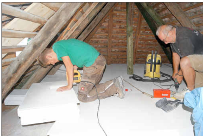
Von oben nach unten: erst das Dach