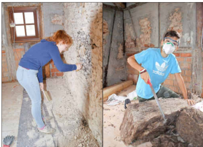
Diese Wand aus Bruchsteinen bleibt erhalten.