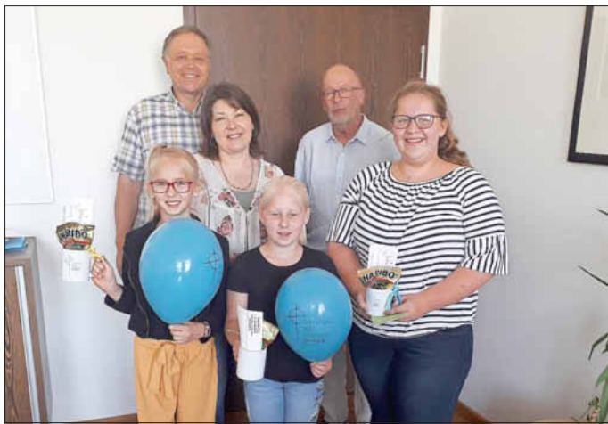
Text u. Bild: Ralf Lischka