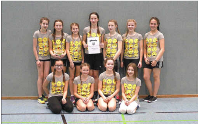
Text u. Foto: Amelie Schneider/Ralf Lischka

Bei allen vier Turnieren hatten alle viel Spaß und es gab keine großen Verletzungen. Viele Teilnehmer fiebern das ganze Jahr hindurch auf diese Turniere hin und gestalten sogar extra T-Shirts (siehe z. B. Siegerteam Völkerball). Im Anschluss an die Finalsspiele wurde dann die Siegerehrung mit anschließendem Fotoshooting abgerundet und jeder Spieler konnte stolz nach Hause gehen.