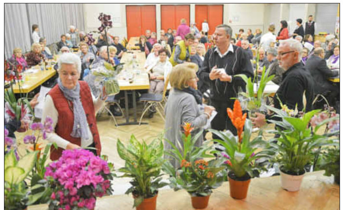
Blütenpracht: Alle Preisträger durften sich Orchideen, Blüten- oder Grünpflanzen als kleines Dankeschön aussuchen.