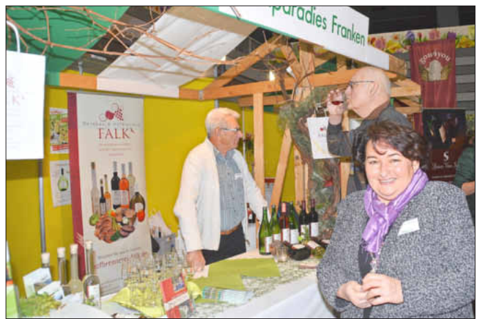
Das Weinparadies Franken war an allen Tagen auf der Freizeitmesse.