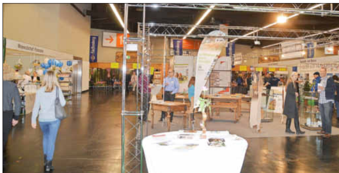
Zusammen mit dem Bezirk Mittelfranken präsentierten sich auch die Partnerregionen in Frankreich und Polen.