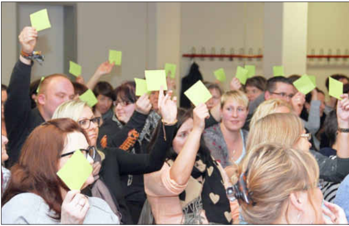
Die Buben und Mädchen zeigten sich danach begeistert und bekundeten, dass sie sich schon auf die Schule freuen.